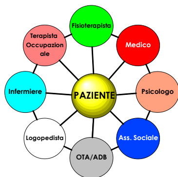
Il Team Riabilitativo

In questo reparto possono essere presenti Operatori Tecnici di Assistenza (OTA/ADB) che collaborano con i diversi operatori per